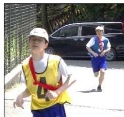
「前走者を追い抜くぞ!」と意気込んで、一生懸命走り続けました。