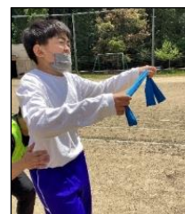
たすき渡しもバッチリでした!