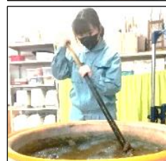
「すくも」がお湯に溶け切るように一人100回以上混ぜました。