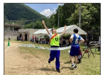
「やったあ! ゴール!」喜びと達成感を全身で表現しています。