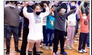
「♪切手のないおくりもの」のダンスを全員で踊りました。