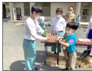
校内販売会は小学部の児童に合わせて、カウンターの前まで出て苗を受け渡すなど、一人一人に合わせて丁寧に接客することができました。