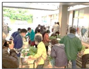
春の苗販売会はあいにくの雨天でしたが、校外からたくさんのお客様に来校いただき大盛況でした。たくさんのお購入や労いのお言葉も、ありがとうございました。

販売会後のまとめでは、「大きな声で接客できました。」「テキパキ動くことができました。」「苗を優しく運ぶのを頑張りました。」と生徒たちは振り返りました。写真等を見ながら指導者からも、できていたことをたくさん評価してもらい、達成感を感じていました。今回学んだことを次の苗販売会に生かし、より良い苗を育て、また接客や対応ができるよう今後も学習に取り組んでいきます。