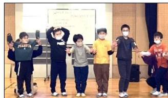
ポーズを決めて学級名を発表することができました！