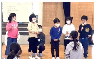
一人ずつマイクを持って名前を発表することができました！

集会の後半は、「集合ゲーム」をしました。2つのプラカードを見せて「校長先生はどちらでしょう？」や「カレーライスとハンバーグ、好きなのはどっち？」等、2択から自分で選んだ答えの場所に集まりました。6年生の掛け声をよく聞いて、自分の選んだ方へ移動することができていました。他学級の友達や指導者と関わり、同じ小学部としての仲間意識をもつことができる良い機会となりました。