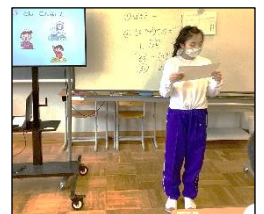
自分で決めた目標をみんなの前で発表しました。