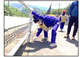
足元をよく見て、小さな落ち葉も拾いました。