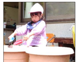
移植ごてをぎゅっと握って一生懸命土を入れています！

販売会では、野菜のカードを見せたり、名前を言ったりして購入したいものを高等部の生徒に伝えました。財布からお金を出して、トレイに入れたり、お辞儀でお礼を伝えたりするなど、購入のやりとりも上手にできました。苗を受け取ると、思わず笑顔がこぼれる様子が見られました。教室に戻った後、植木鉢に土を入れて苗植えもしました。大きな植木鉢が土でいっぱいになるよう何度も移植ごてで土をすくいました。販売会以降毎朝、自分たちで水やりを行っています。ぐんぐんと大きくなっていく様子に皆は興味津々です。今後も成長の過程を観察していきます。