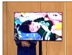
訪問生は動画を映して発表しました！